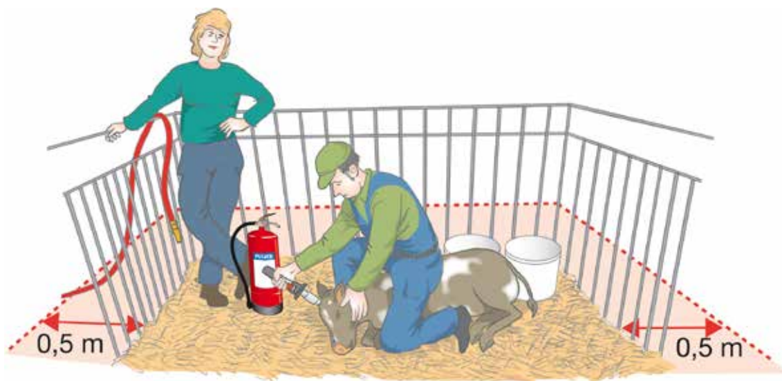
Bild 7.2 Hornbränning i kalvbox